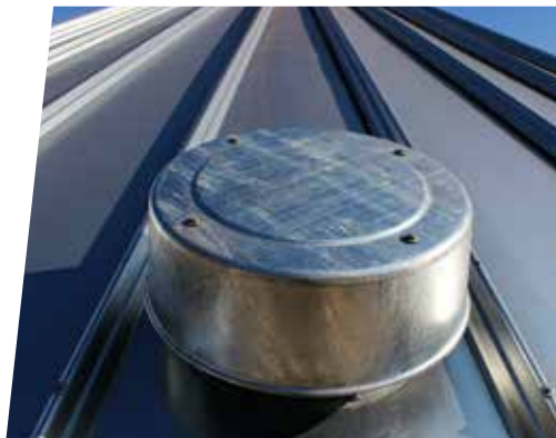
TOBERA DE AIREACIÓN