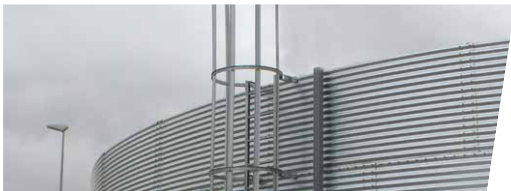
ESCALERA DE ACCESO