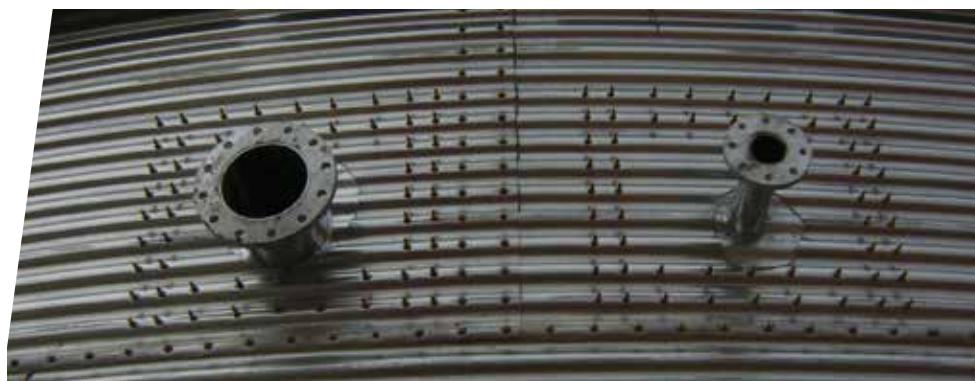
CONEXIONES DE ENTRADA Y SALIDA