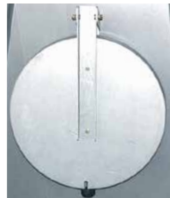
PUERTA DE INSPECCIÓN EN TECHO