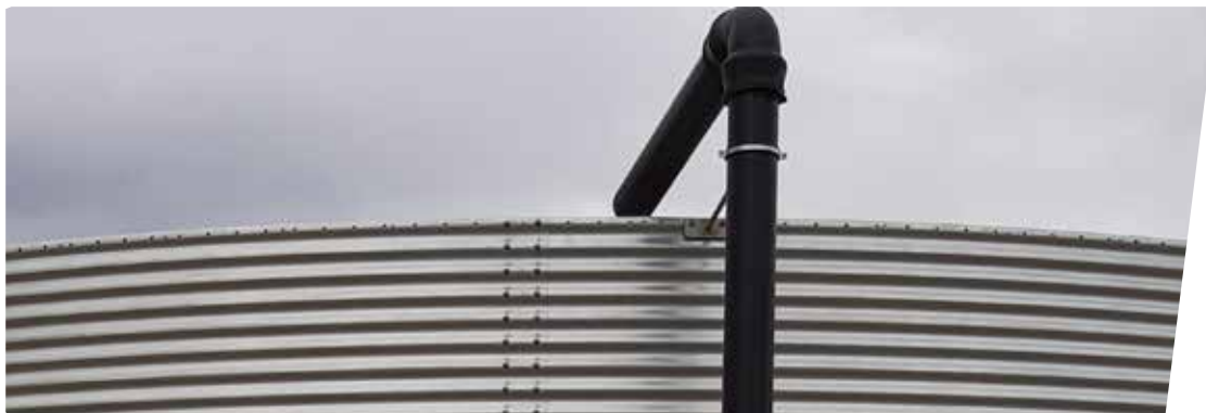
TUBO DE LLENADO